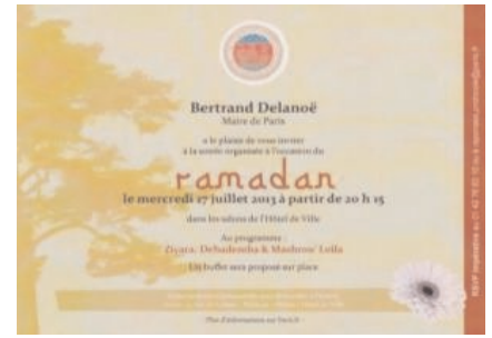
Ramandan fêté par le maire