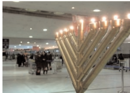
Aéroport de Roissy