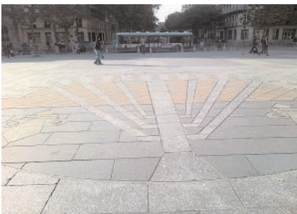
Parvis de la mairie de Paris